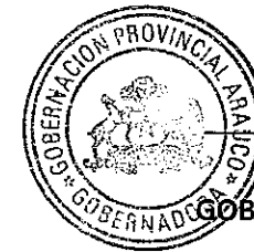
FLOR ISABEL WEISSE NOVOA GOBERNADORA PROVINCIAL DE ARAUCO