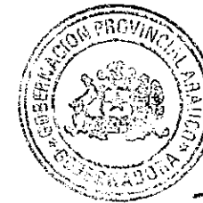
FLOR ISABEL WEISSE NOVOA GOBERNADORA PROVINCIAL DE ARAUCO