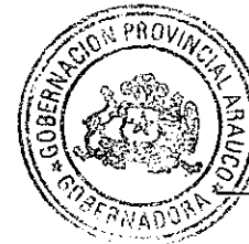
FLOR ISABEL WEISSE NOVOA GOBERNADORA PROVINCIAL DE ARAUCO